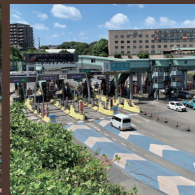
③東名高速道路 川崎IC