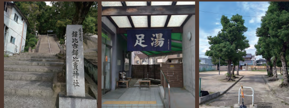
①鐺比古鐺比賣神社 ②ほのかたしも足湯 ③法善寺公園

アクセス 電車でお越しの方 近鉄大阪線「法善寺」駅より徒歩約 1 分(約80m) お車でお越しの方 近畿自動車道「長原」ICより約 18 分