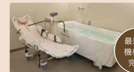
最新の機械浴完備

スタッフの介助・見守りのなか、ゆったりと入浴することができ、お身体の状態に合わせて機械浴も設置。安心して入浴していただけます。