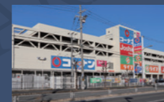
①ライフ・コーナン