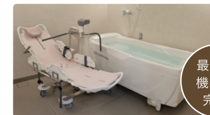
最新の機械浴完備

スタッフの介助・見守りのなか、ゆったりと入浴することができ、お身体の状態に合わせて機械浴も設置。安心して入浴していただけます。