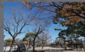
④ 佐井寺南が丘公園