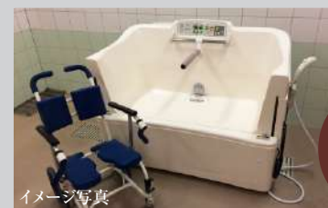
最新の機械浴完備