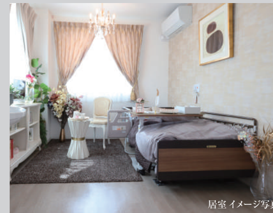
居室イメージ写真