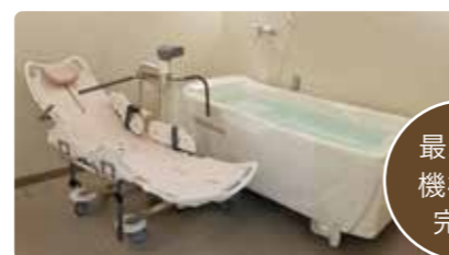
最新の機械浴完備

スタッフの介助・見守りのなか、ゆったりと入浴することができ、お身体の状態に合わせて機械浴も設置。安心して入浴していただけます。